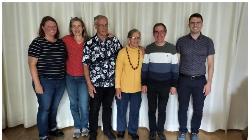
Vorstand KFK (v. links nach rechts)